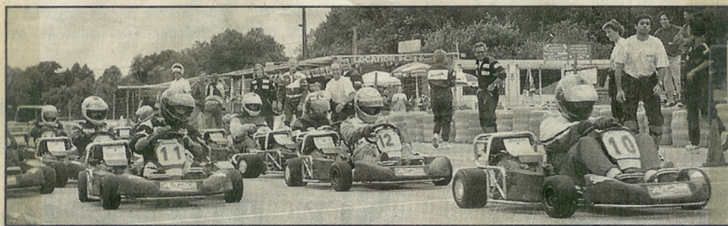
C'est parti pour une heure d'endurance.

Après quelques minutes du départ arrêté, les stands du Karting Club de Trets ressemblaient à une véritable fourmilière. Les vingt pilotes venus pour la fête du club étant décidés à en découdre dans la course d'endurance avec relais.